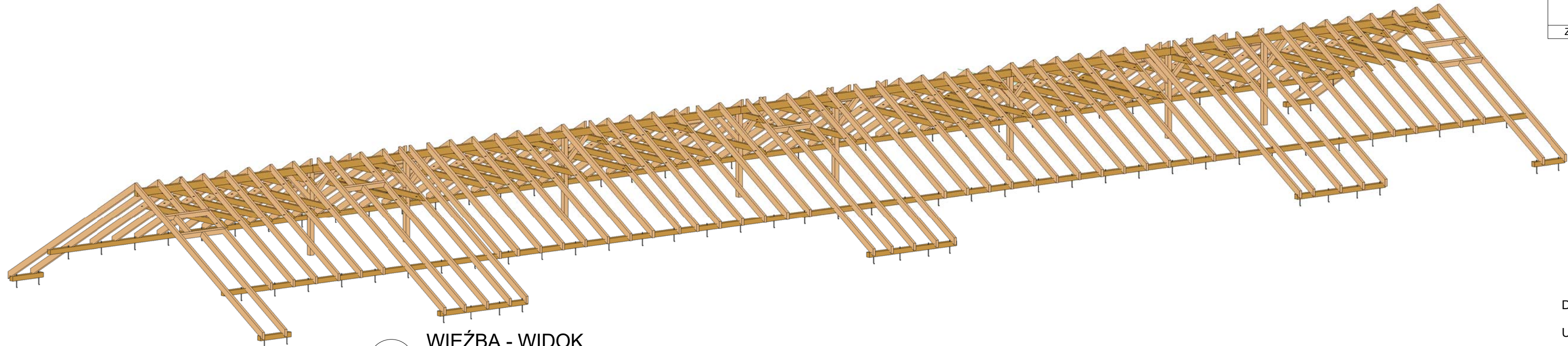
2 WIEŻBA - WIDOK